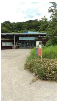
Weg zum Eingang