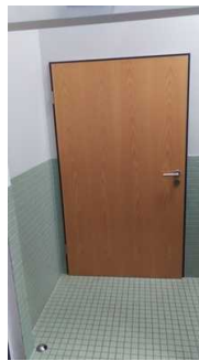
Flur zur Toilette